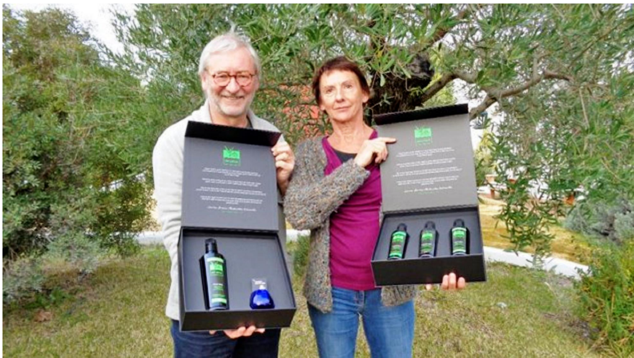
Truienaren krijgen Golden award op 'The Best Olive Oils of the World'

03/05/2017 om 17:07 door Jozef Croughs - Print - Corrigeer (mailto:redactienbo@nieuwsblad.be?subject=Correctie%20-%20'Olijfolie%20van%20Truienaren%20valt%20in%20de%20prijzen%20in%20New%20Yc